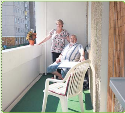
Fam. Wiek hofft, dass alles klappt ...

Die Punkthäuser Zossener Straße 66 und 68, nahe am Wuhle-Wanderweg gelegen, erhalten in den nächsten Wochen ein neues Gewand. Um Energie in Größenordnungen sparen zu können, wird das Doppelgebäude mit einem Wärmedämm-Verbundsystem umhüllt. Die Fassade wird dann auch von neuen, architektonisch überaus interessanten Loggien repräsentiert. Diese sind nicht nur breiter, nutzerfreundlicher, sondern an den sonnenbeschienenen Hausseiten schlingen sie sich um die Ecken – der Bewohner kann also mit der Sonne mitwandern. Das ist nur ein prächtiger Tupfer der innovativen Modernisierung. Weitere sind dann die großflächigen und weithin sichtbaren künstlerischen Blumenmotive an allen Seiten der 11-geschossigen Wohnhäuser. Der wv sorgfältig abgestimmt auf den Tischen der Verantwortlichen, die Mieter sind informiert. Aufregung und Gelassenheit bilden das Startgespann. Wird alles so klappen wie es soll? Wer einmal selber gebaut, renoviert und repariert hat weiß, dass die Tücke immer im Detail steckt – Fachwissen und Konzentration sind dann mehr denn je gefragt. In den kommenden Wochen werden wir den Baufortschritt dokumentieren. Mieter und Fachleute kommen zu Wort. Fotos zeigen das Vorher und Nachher. Sie, liebe Leser, sind herzlich eingeladen, uns bei der beeindruckenden Verwandlung eines Plattenbaus zu begleiten.